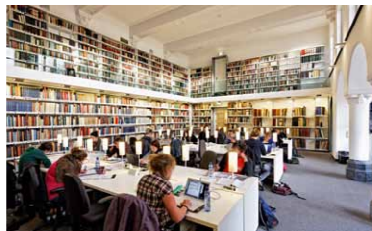
FOTO BOVEN De voormalige leeszaal is ook nu weer in gebruik als studiezaal